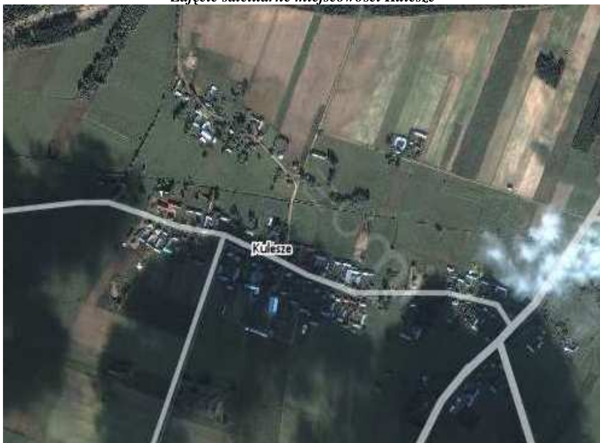
Fotografia Nr 1. Zdjęcie satelitarne miejscowości Kulesze